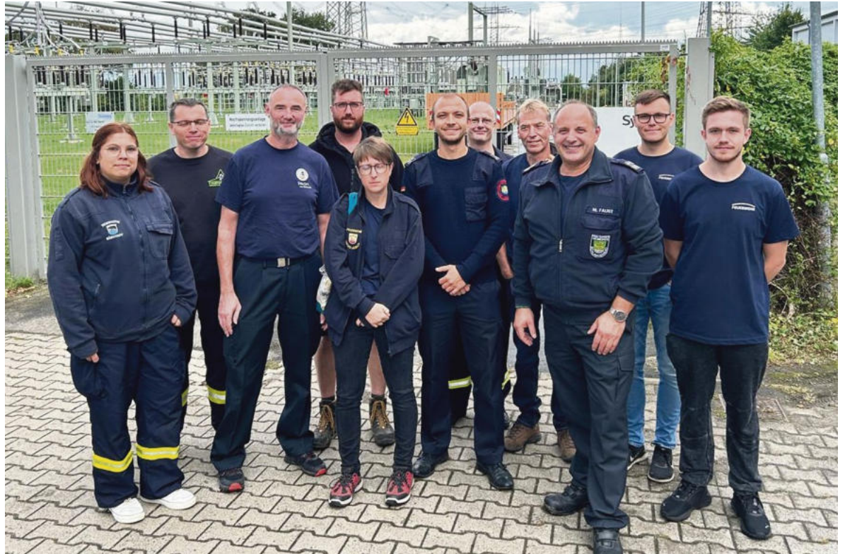
Gruppenbild der Teilnehmer der Schulung des Energieversorgers Syna

Die mobile Übungsanlage im Disconeibel der Brandsimulation. Im blauen Container fand die Personensuche in einer Wohnung, rechts im grauen Container die Brandsimulation und Menschenrettung statt.