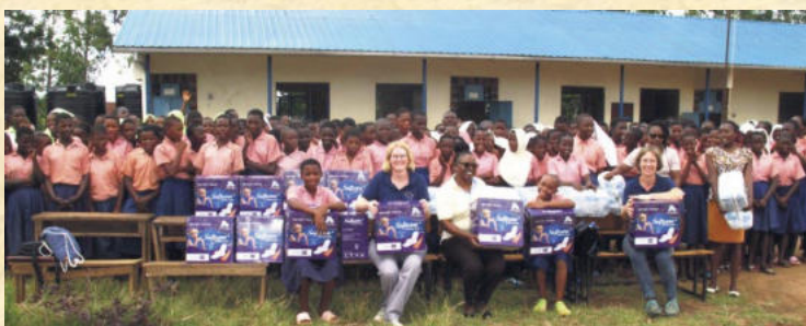
Unser Projektteam mit den Schülerinnen bei der Übergabe an der Mamba-Primary-School

Helfen Sie mit und unterstützen Sie unsere Arbeit – Jeder kleine Betrag hilft! Vielen Dank!