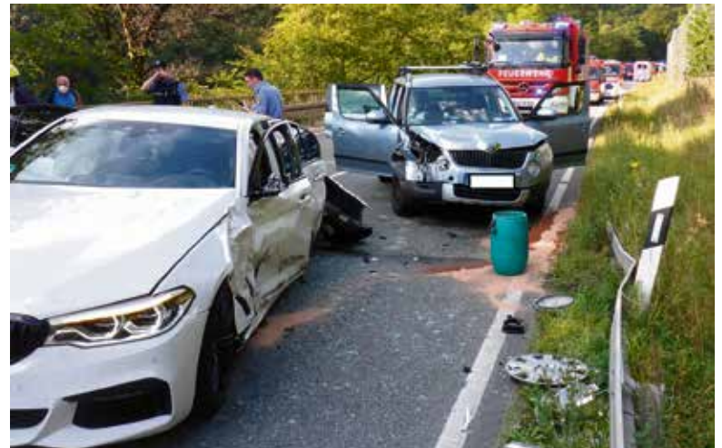
Ein Bild der Einsatzstelle in der Auf der B 260. Die beiden anderen PKW stehen ca. 100 m entfernt.

Bei Rückfragen: 0163 / 4458315 Marius Hopf, Feuerwehr der Gemeinde Schlangenbad – Presse- und Öffentlichkeitsarbeit –