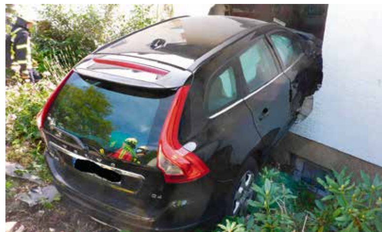
Ein Bild der Einsatzstelle im Nonnenwaldweg. Der verunfallte PKW in der Hauswand.

Bei Rückfragen: 0163 / 4458315 Marius Hopf, Feuerwehr der Gemeinde Schlangenbad – Presse- und Öffentlichkeitsarbeit –